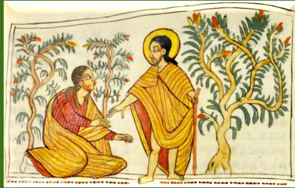
Handschrift aus Märtula Maryam 17. Jh.